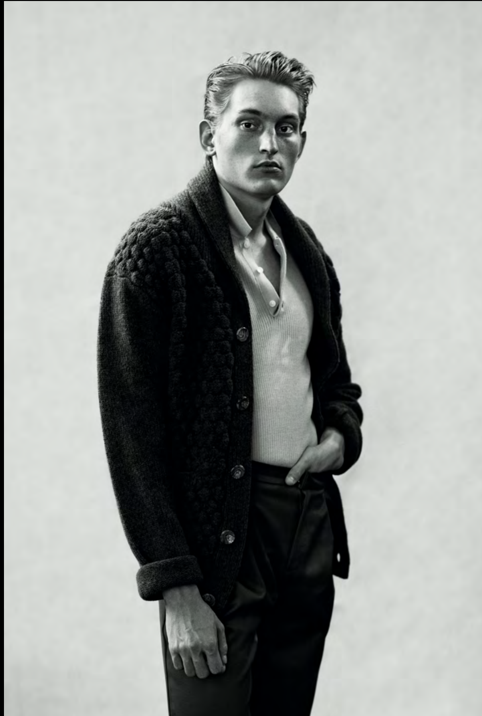
Shirt: BEN SHERMAN, Cardigan: PROS, Hose: JIL SANDER