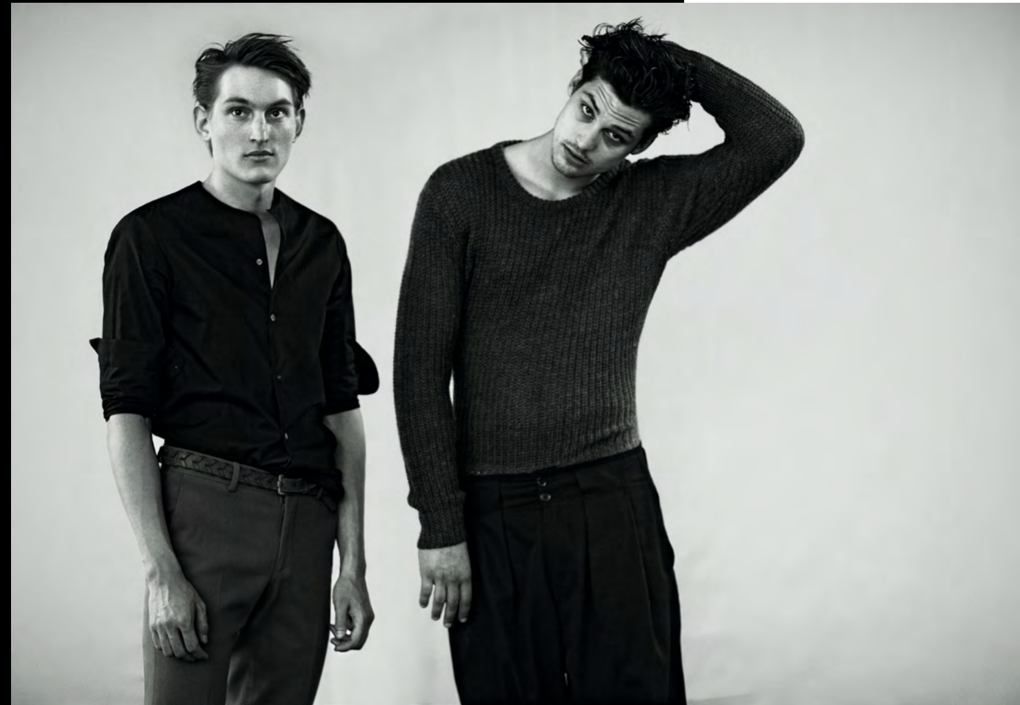
links: Pullover: BURBERRY, Weste: MAISON SCOTCH, Sakko: COS rechts: Hemd: COS, Hose: ETRO, Gürtel: D&G // Pullover: WEEKDAY, Hose: LANVIN